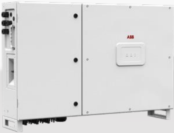
— String-Wechselrichter PVS-50/60-TL

Diese neue Ergänzung der String-Wechselrichterfamilie PVS mit drei unabhängigen MPPT und einer Nennleistung von bis zu 60 kW soll die Anlagenrendite in Grosssystemen maximieren. Sie bietet alle Vorteile einer dezentralen Konfiguration sowohl für ebenerdige als auch Dachinstallationen.