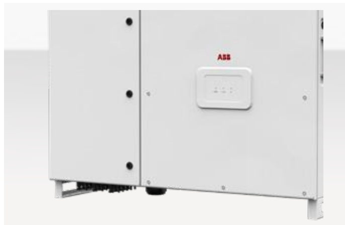
ABB String-Wechselrichter PVS-50/60-TL